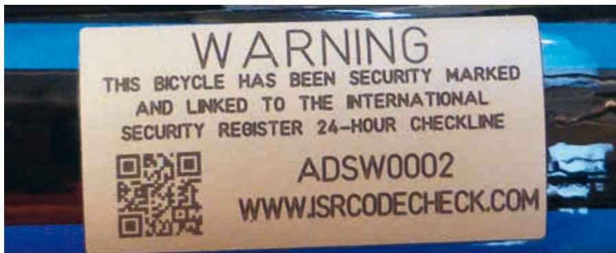
En del av ISR-märkningen är en QR-kod som kan skannas för att se om cykeln är stulen.